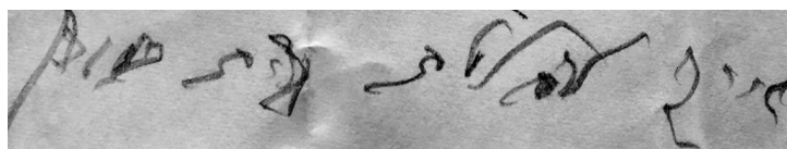
לקמון מענה קמ